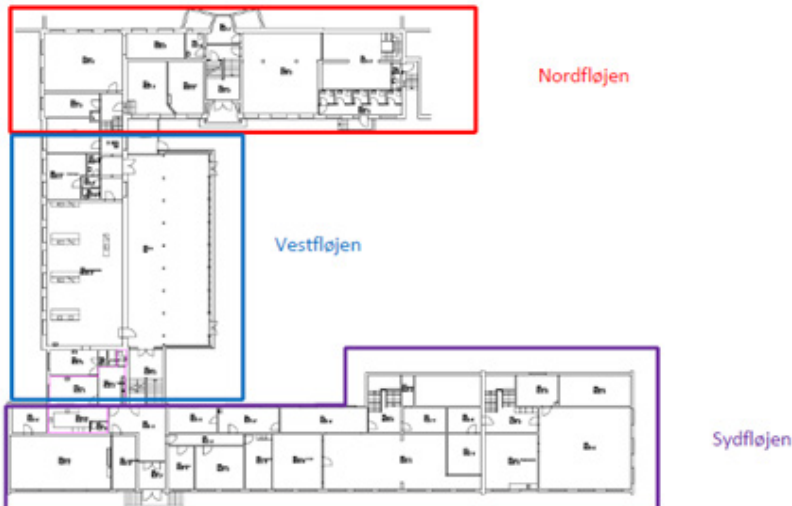
Eksisterende forhold underplan